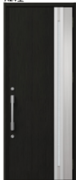
トリノパイン 設定色:⑩⑪⑫⑬⑭⑮ ⑯