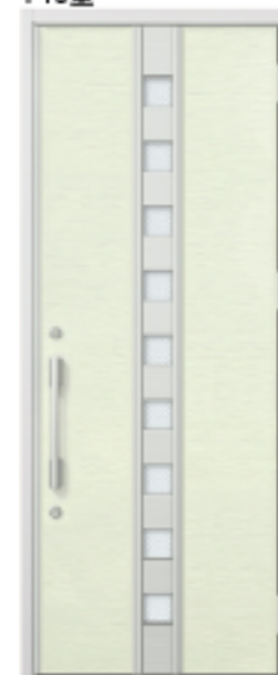
レリーフホワイト 設定色:⑤⑥⑦⑧⑨⑩ ⑪⑫⑬⑭⑮