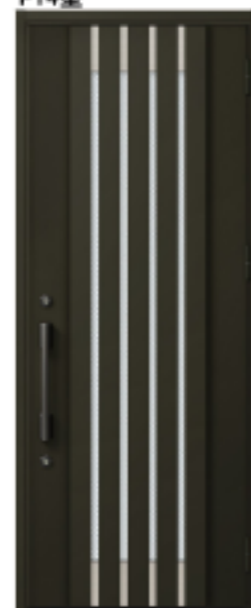
オータムブラウン 設定色:⑤⑥⑦⑧ ⑨⑩⑪⑫⑬⑭⑮