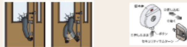
従来のサムターン セキュリティサムターン(取り外した状態)

ボタンを押すだけで、サムターンの取り外しが可能。外出時や就寝時に外しておけば、万が一アヤや窓ガラスに穴をあけられても、「サムターン返し」で開けられる心配がありません。