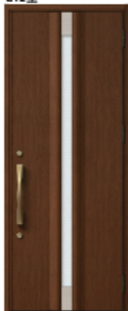
ポートマホガニー 設定色:⑤⑥⑦⑧⑨