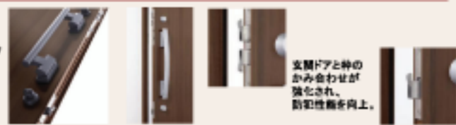
玄関ドアと枠の かみ合わせが 強化され、 防犯性能を向上。

『ジェスタ』の玄関ドアは、ピッキング対策に効果的な2ロックを標準装備。さらに、上部ロックに2つ、下部ロックに1つ、鎌付デッドボルトを採用することで、「こじ破り」に対する抵抗力を高めています。