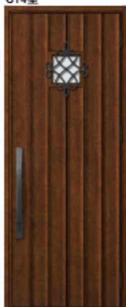
ハンドダウン チェリー 設定色:①②③④