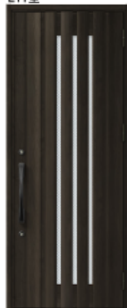
クリエダーク 設定色:⑤⑥⑦