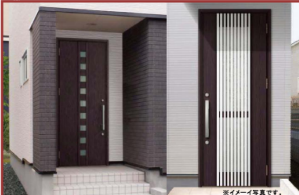
※イメージ写真です。