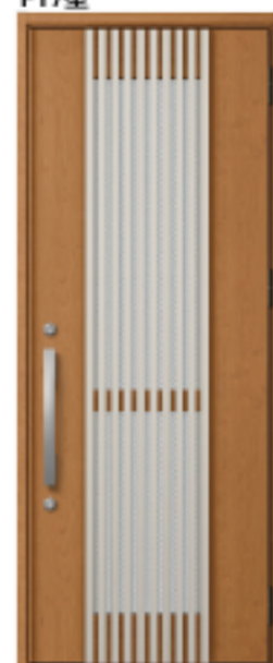
クリエラスク 設定色:⑤⑥⑪