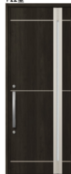
クリエダーク 設定色:⑤⑥⑪⑫⑬