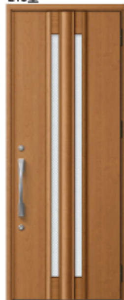
クリエラスク 設定色:⑤⑥⑦⑧⑨