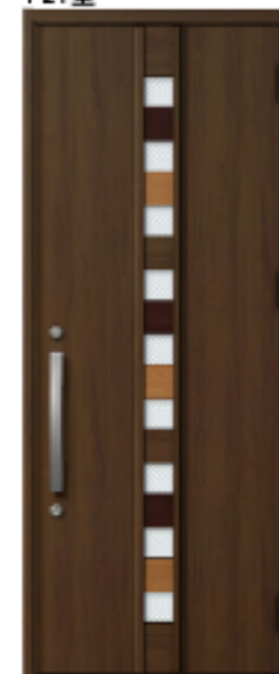
クリエモカ 設定色:⑤⑥⑪