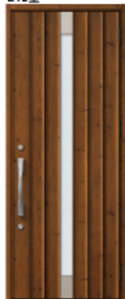
アイリッシュパイン 設定色:①②③④⑤⑥ ⑩⑪⑫⑬⑭